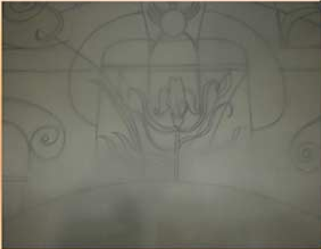
Рисунок аккуратно наносится на ткань. Используется заранее разработанный эскиз, композиция, цвет. Для нанесения рисунка используется карандаш средней мягкости.